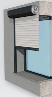
Type 3 En façade