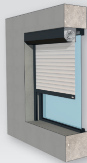
Type 2 Enroulement Intérieur