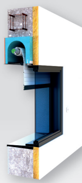
Pose Coffre tunnel Enroulement Intérieur/extérieur