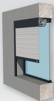
Type 1 Enroulement extérieur