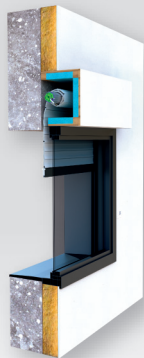
Pose Traditionnelle Enroulement Intérieur