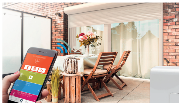
Possibilité d'utiliser votre smartphone comme télécommande