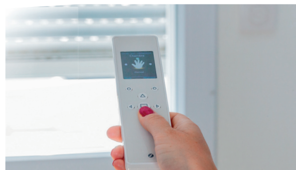
Commande générale radio intuitive avec retour d'information + 10 horloges